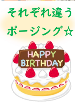
それぞれ違うポージング☆