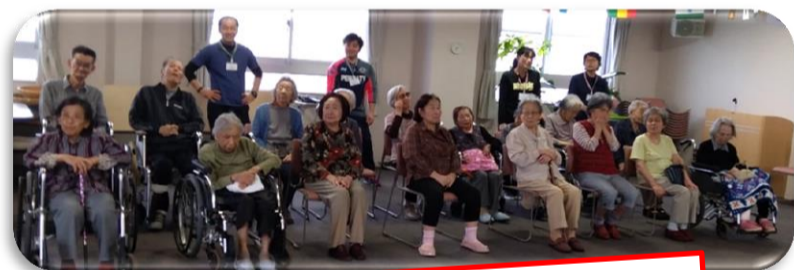
火花散る熱い戦い!

食欲の秋、読書の秋と様々ありますが忘れてはならないのがスポーツの秋です。10月26日、体操サークルの時間を使い、すしんピック」を行いました。フロアごとによる対抗形式で競技を行い、パン食い競争、玉入れといった馴染みの競技から職員がストッキングを被り引っぱり合う綱引きなど、体を動かすだけでなく笑いの多い時間となりました。頑張れ!の声援に後押しされるようにご利用者の負けるものかと真剣な表情に会場は大興奮でした。昔はかけっこも早かったの」と話される姿はとてもしきいききとしておられます。