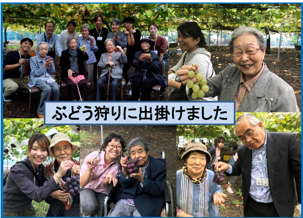
ぶどう狩りに出掛けました

秋風が心地よく、暖かい陽気に誘われて十月中旬に葡萄狩りに出かけました。安来市の道の駅(あらえっさ)の近くにありますが岩崎農園に協力いただき、皆様と出かけました。外出をされると皆様心踊り自然と笑顔の会話が増えます。そんな雰囲気の中で、職員も大変うれしく感じる道中でした。農園では数種類の葡萄と席が設けてあり、到着してすぐに葡萄を満喫することが出来ました。