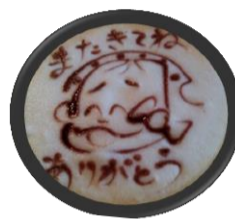
かわいいラテアートでした

昼食は和銅博物館内にある、ぐらんぱで頂きました。皆様が事前選ばれた食事が一皿ごとに運ばれると、あなとは何にしたの?と普段は一緒に食事をする機会のない職員とゆったりとした食事となりました。食後の飲み物に「また来てね」とのラテアート。また足を運びたいくなるお店でした。楽しい時間と美味しい食事、次回も皆様に喜んで頂ける外出を計画していきます。