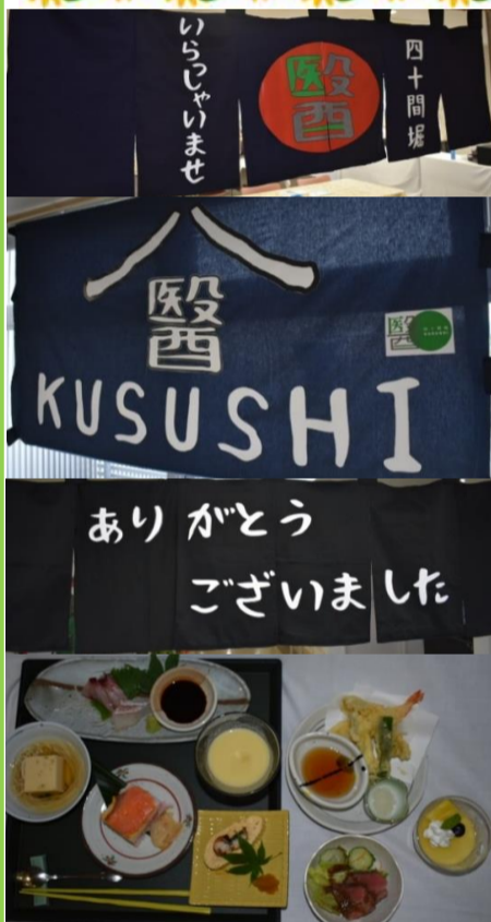
料亭 醫へようこそ♪

七月二十八日に会席膳を行いました。今回は和食がメインということでも、会場も料亭をイメージして飾り付けしました。 メニューには、アツアツのてんぷらや、鮮度抜群のお造り、押し寿司にローストビーフ等盛り山のメニューとなりました。 皆さんから、今までの会席膳で一番良かった。「味が良くて箸が進んだわ。」等と沢山うれしい言葉が聞かれました。 暑くて食欲が進まない時期となりましたが、四十間堀醫の皆さんは食欲満点ですよ。これからも沢山美味しい食事を食べて元気に過ごしましょう。