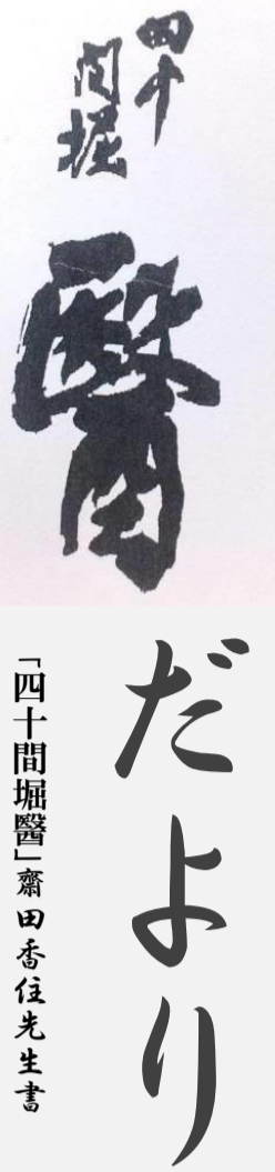
「四十間堀醫」齋田香住先生書